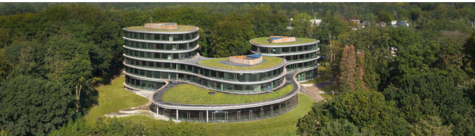
Rau Architects. Zijanzicht circulair hoofdkantoor Triodos Bank op landgoed De Reehorst.

een loopje genomen met het begrip. Bedrijven plakken de term circulair op dezelfde activiteiten die ze eerder ook al deden. “Er is niets veranderd, alleen de naam van het hoofdstuk.” Of ze schakelen circulariteit gelijk aan duurzaamheid. “Dat is een misverstand, duurzaamheid is nog altijd lineair.” Of ze pretenderen een circulair gebouw te hebben ontwikkeld. “Dat is onmogelijk, want het is aan de volgende generatie om te bewijzen of dat werkelijk zo is.” Of ze denken dat het een trucje is dat je moet toepassen. “Wat ik erg mis, is het willen doorgronden van de werkelijke diepgang van circulariteit”, vindt Rau.